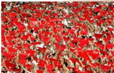
Dax la Feria !